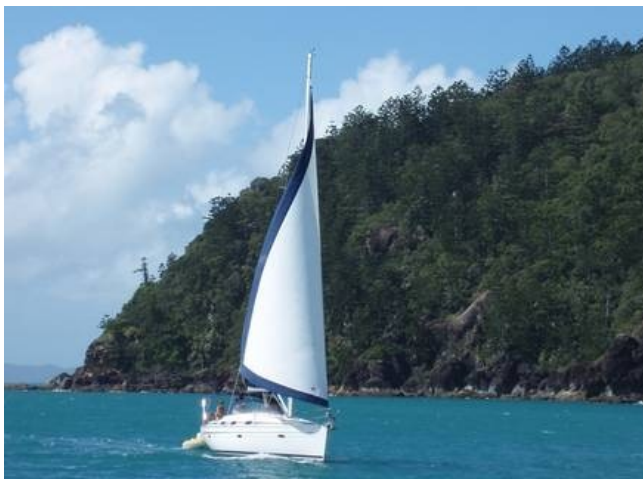
Rys. 3: Nie możesz wpływać na kierunek wiatru, ale zawsze możesz odpowiednio ustawić żagle.

Jak mawiał Henry Ford: „Porażka to tylko szansa na mądrzejsze rozpoczęcie od nowa”. Zdobądź się na odwagę i wyjdź poza strefę komfortu. Wizualizuj efekt osiągnięcia celu i swoją radość z tego tytułu. Ustalaj racjonalne i jednocześnie ambitne cele.