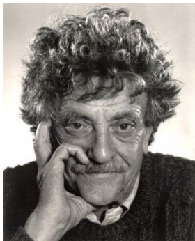
Rys. 5: Kurt Vonnegut.

Strategia osiągania celów Vonneguta pochodzi od znanego, genialnego powieściopisarza — Kurta Vonneguta. Odzwierciedla ona sposób, w jaki Vonnegut pisał swoje książki, tworząc fabułę i rozwijając wątki od tyłu.